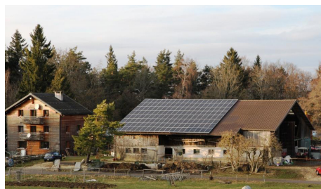
Centrale solaire du Mont-Dedos, projet lauréat 2013

L'association Ecoparc a accompagné, pour la troisième édition, le Canton du Jura dans l'organisation de son Prix du développement durable. Cette distinction, dotée d'un montant de 10'000.- CHF s'adresse aux entreprises et collectivités du Canton du Jura et récompense les réalisations exemplaires du point de vue du développement durable. Cette année, le choix du jury s'est porté sur le projet de centrale solaire de l'association Photovolpotat, une initiative originale et citoyenne qui a permis de créer un partenariat entre particuliers, autorités communales et gestionnaire de réseau, autour d'un projet collectif d'installation solaire photovoltaïque.