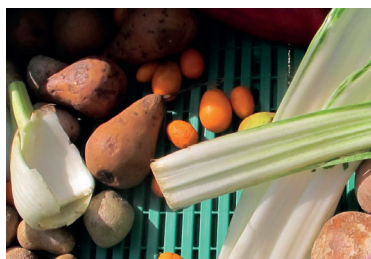
Projet de lutte contre le gaspillage alimentaire de l'Association Alternative Etudiante Durable, lauréat de l'appel à projet de la CUS.

Parmi les projets de l'UniNE, citons notamment la mise en place du Prix académique du développement durable, lancé au tout début 2014, un accompagnement assidu pour la création d'un atelier de réparation de vélo, adressé à la communauté étudiante,