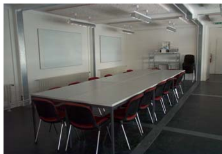
Salle de conférence, 30 personnes, 75 m 2